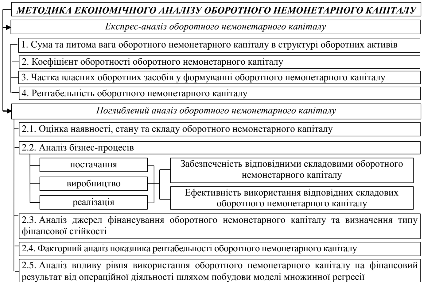
Рис. 4. Етапи економічного аналізу оборотного немонетарного капіталу

його нематеріальної частини, дозволили обґрунтувати методика економічного аналізу (рис. 4).