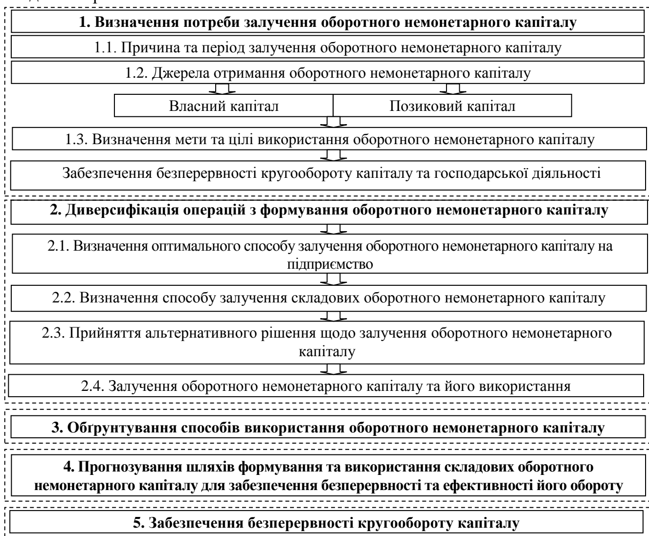
Рис. 3. Механізм формування та використання оборотного немонетарного капіталу в системі тайм-менеджменту

Механізм формування та використання оборотного немонетарного капіталу наведено на рис. 3.