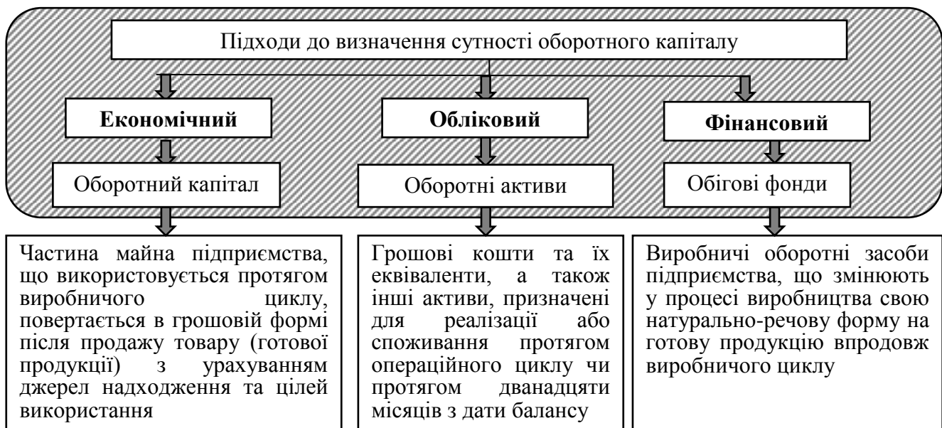
Рис. 1. Трактування сутності оборотного капіталу: міждисциплінарний аспект

Трактування сутності оборотного капіталу відрізняється з економічної, облікової та фінансової точок зору. При перенесенні економічних та фінансових підходів до розуміння сутності оборотного капіталу в систему бухгалтерського обліку відбувається підміна базових понять існуючого категорійно-понятійного апарату, що в цілому призводить до хаотизації наукових досліджень в сфері бухгалтерського обліку. Для вирішення цієї проблеми проведено розмежування підходів до розуміння сутності оборотного капіталу в міждисциплінарному контексті на основі виділення їх характерних ознак (рис. 1).