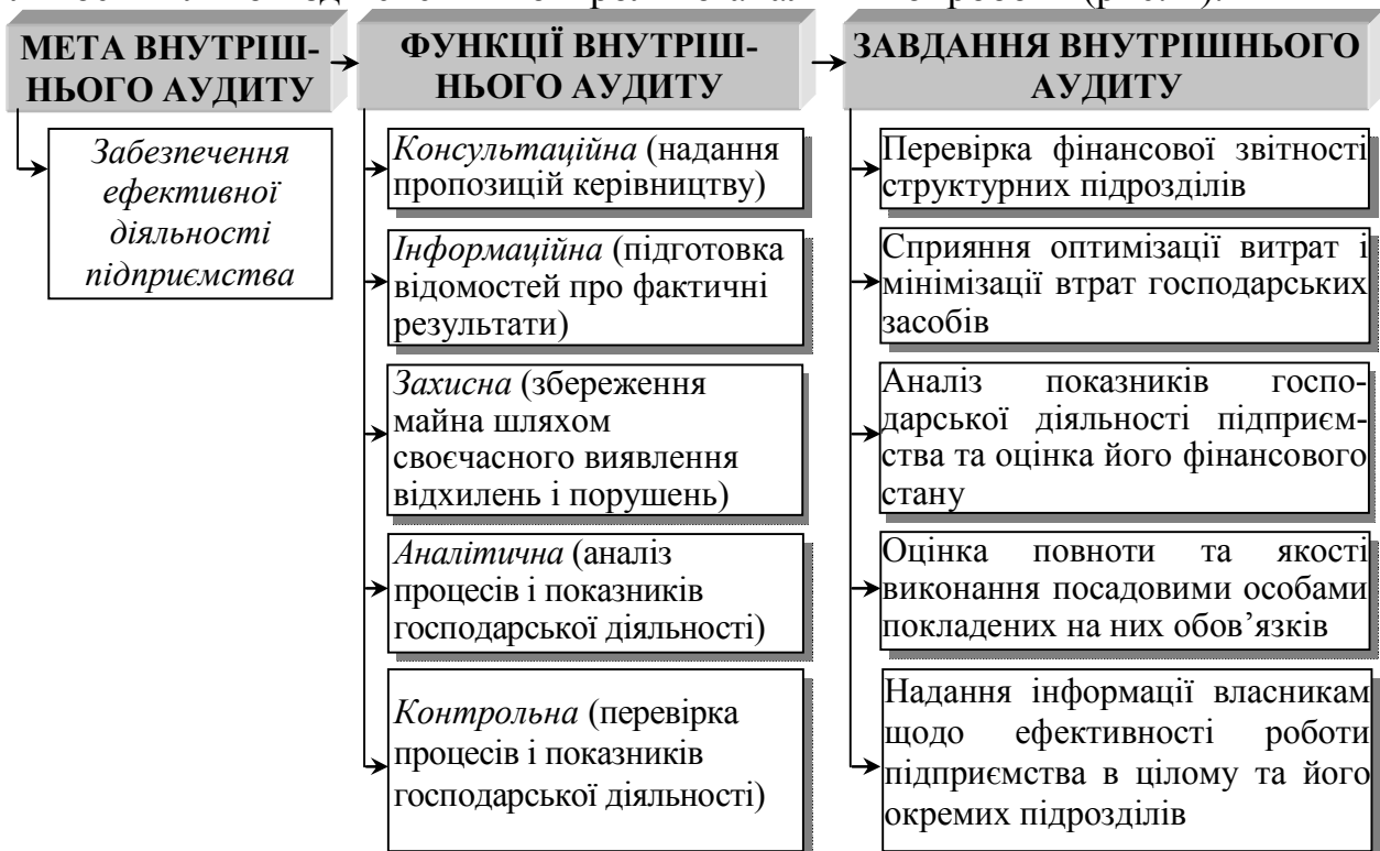
Рис. 2. Мета, функції та завдання внутрішнього аудиту

Проведене дослідження показало, що внутрішній аудит запроваджується у зв'язку з потребою власників в організації додаткового незалежного контролю ефективності використання ресурсів. Останнє визначає мету, функції та завдання внутрішнього аудиту, які спрямовані на забезпечення ефективності господарської діяльності шляхом здійснення контрольної-аналітичної роботи (рис. 2).