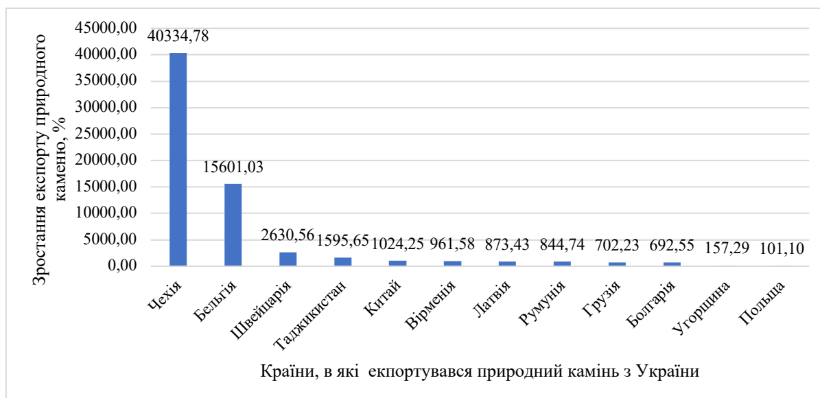
Рис. 3. Тенденція зростання експорту природного каменю з України в 2023 році, порівняно з 2022, роком у %

У 2023 році географія експорту природного каменю з України поповнилася країнами: Японія, Швеція, Чорногорія, Фінляндія, Туркменістан, Туреччина, Сполучені Штати Америки, Тайвань, Саудівська Аравія, Монако, Мексика, Кіпр, Канада, Ісландія, Ірак, Індія, Боснія і Герцеговина, Бангладеш. Обсяг експорту в ці країни незначний – 4,8 % від загального експорту, але на даний час ми бачимо в 2023 році поживлення торгівлі природним декоративним каменем.