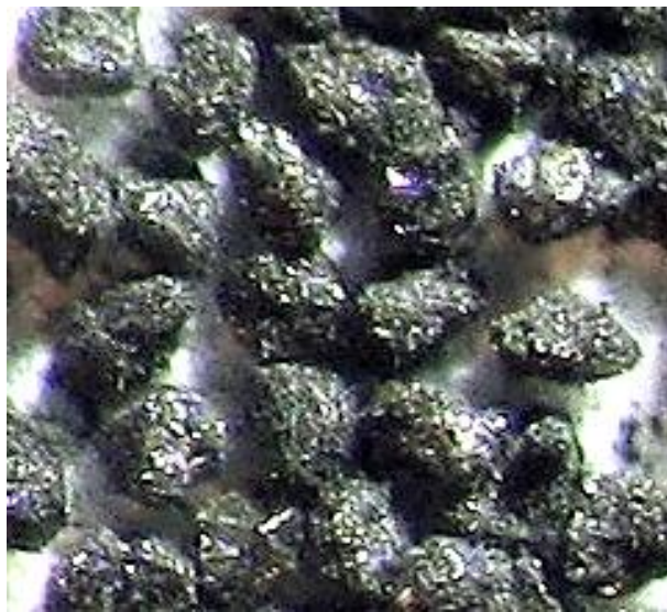
Рис. 2. Компакти марки КБ зернистістю 160/125 на основі карбіду бору

Вкажемо, що вибір карбіду бору як складової компакту викликаний двома обставинами: по-перше, температура початку його окислення знаходиться в межах 600 °С, а це є важливим для нас з точки зору отримання покриття на алмазних зернах (В 2 О 3 ), і, по-друге, відомо [2], що карбід бора добре працює в умовах абразивного зношування, яке є якраз характерним для процесів абразивної обробки, тобто його добавка у компакт повинна додати у зносостійкості. При виготовленні компактів марки КБ застосовувалась суміш зерен АС6 125/100 (40%), В 4 С 80/63 (40%) та мікропорошку КМ 3/2 (20%).