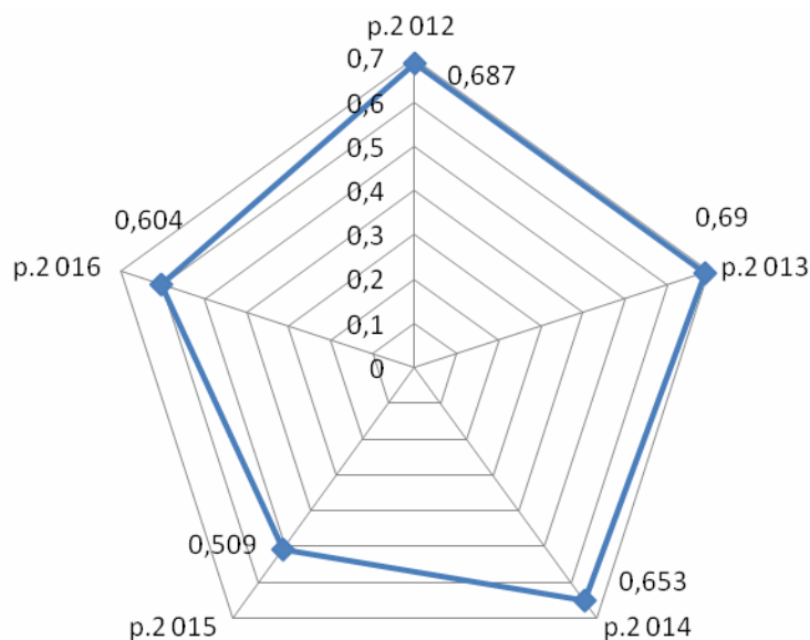
Рис. 1. Динаміка зміни рівня фінансування кримінально-виконавчої системи України за 2012–2016 рр.

Емпірне зображення рівня фінансування кримінально-виконавчої системи свідчить про його низький рівень (рис.1).