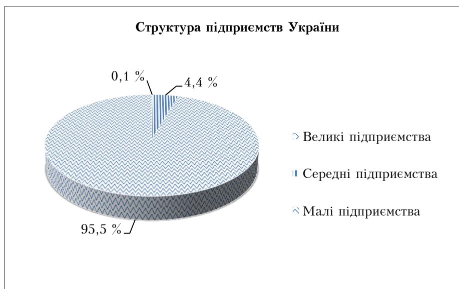
Рис. 1. Структура підприємств за розмірами у загальній кількості підприємств України, станом на 2015 рік [3]

За даними Держкомстату України, станом на 01.01.2015 року, в Україні налічувалося 343440 суб'єктів господарювання, з яких 327815 суб'єктів малого підприємництва. Протягом 2011–2013 років спостерігається значне зменшення кількості суб'єктів малого підприємництва, а також, зменшення кількості суб'єктів господарювання середнього підприємництва. Дослідження структури підприємництва в економіці України у 2012–2015 роках зображено на рисунку 1.