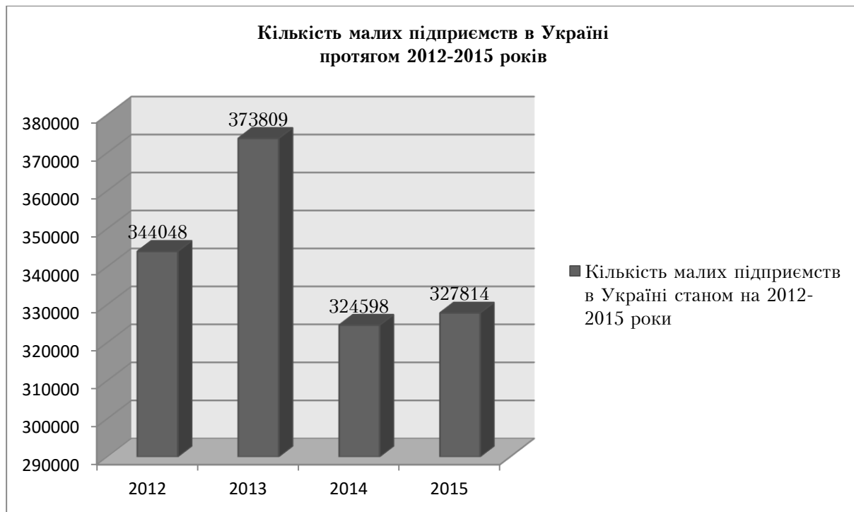
Рис. 3. Кількість малих підприємств в Україні, станом на 2012–2015 роки [3]

Основними причинами, що перешкоджають розвитку малого та середнього підприємництва є: – нестача внутрішніх фінансових ресурсів, складність доступу до зовнішніх джерел фінансування та залучення інвестицій; – неналежний рівень розвитку інфраструктури підтримки малого підприємництва; – ускладнений порядок проходження дозвільних (погоджувальних) процедур і, як наслідок, їх висока витратність; – недосконалість процедур здійснення державного нагляду (контролю) у сфері господарської діяльності; – складність процедур сертифікації і стандартизації товарів та послуг; – нестабільність законодавства у сфері розвитку малого підприємництва, що не дає можливості суб'єктам підприємництва планувати свою діяльність протягом тривалого періоду; – недосконалість механізму партнерства між державою та малим підприємництвом; – низький рівень активності суб'єктів малого підприємництва щодо захисту власних інтересів; – неналежний рівень інформаційного, консультативного та методичного забезпечення підприємницької діяльності, у тому числі, з питань сертифікації продукції та послуг, а також запровадження систем управління якістю; – недосконалість системи підготовки, перепідготовки та підвищення кваліфікації кадрів для суб'єктів малого підприємництва; – низький рівень залучення молоді та сільського населення до малого підприємництва.