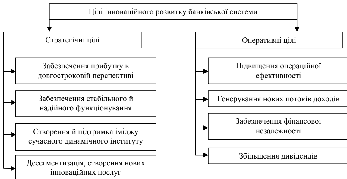
Рис. 2. Цілі інноваційного розвитку банківської системи (складено авторами на основі [4, с. 40])

Необхідність впровадження інновацій у банківську діяльність зумовлена стратегічними та оперативними цілями, які банки визначають перед собою (рис. 2).