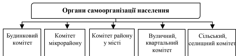
Рис. 2. Адміністративно-матеріальні одиниці органів самоорганізації населення

Органи самоорганізації населення створюються за ініціативою самих жителів та з дозволу відповідної сільської, селищної, міської, районної у місті (у разі її створення) ради на окремих частинах відповідних адміністративно-територіальних одиниць, а саме: сільського, селищного комітету — в межах території села, селища, якщо його межі не збігаються з межами діяльності сільської, селищної ради; вуличного, квартального — в межах території кварталу, кількох або однієї частини вулиць з прилеглими провулками у місцях індивідуальної забудови; комітету мікрорайону — в межах території окремого мікрорайону, житлово-експлуатаційної організації в містах; будинкового — в межах будинку (кількох будинків) в державному і громадському житловому фонді та фонді житлово-будівельних кооперативів; комітету району у місті — в межах одного або кількох районів у місті, якщо його межі не збігаються з межами діяльності районної у місті ради (ст. 14) [5].