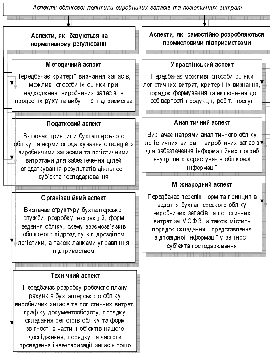
Рис. 3. Аспекти облікової політики виробничих запасів та логістичних витрат підприємства

У нашому дослідженні дотримуємось позиції Н.С. Сахчинської [4], яка зазначає, що суб'єктам господарювання притаманно сім аспектів облікової політики: методичний, організаційний, технічний, податковий, управлінський, аналітичний та міжнародний. Виходячи з даної позиції, нами розкрито складові облікової політики виробничих запасів та логістичних витрат, пов'язаних з їх рухом, на промислових підприємствах (рис. 3).