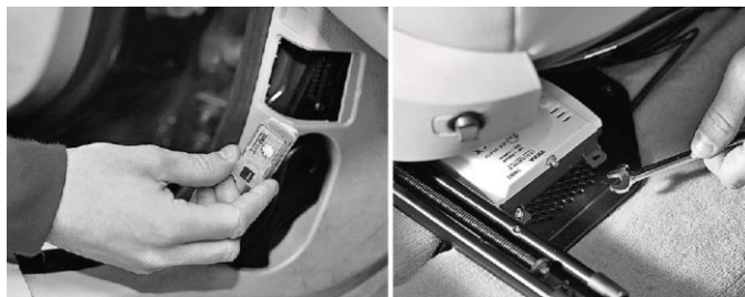
Рис. 1. Блок-передатчик системи дистанційної діагностики TEXA

Розглянувши основні тенденції досліджень в сфері електронної діагностики, проаналізувавши можливості, щодо збору та обробки даних за допомогою штатних електронних ЕБК вузлами та агрегатами автомобіля, за умови доукомплектування бортової електронної мережі автомобіля системою дистанційної передачі діагностичних даних, авторами запропонований наступний принцип експлуатації автомобіля, планування та проведення його ТОіПР. До діагностичного роз'єму автомобіля підключається спеціальний декодер передатчик (рис. 1), що отримує експлуатаційні дані з ЕБК вузлів та агрегатів двигуна, та передає їх в реальному часі до сервера збору та обробки даних по бездротовим технологіям. Як варіант програмної реалізації взаємодії взята система компанії TEXA, що дає можливість фахівцям сервісного центру отримувати інформацію про стан автомобіля у реальному часі по каналах GPRS, Wi-Fi або 3G.