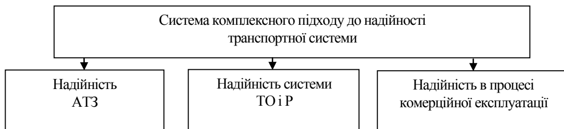
Рис. 1. Загальний підхід до надійності

Наблизитися до такої імовірності можливо саме при комплексному підході до надійності транспортної системи (рис. 1). При цьому надійність АТЗ базується на класичному підході до надійності, що досліджує надійність всіх систем та механізмів АТЗ, що в останніх роботах отримала назву «механічна надійність» [1], а надійність системи ТО і Р та надійність в процесі комерційної експлуатації враховують також організаційні та економічні фактори.