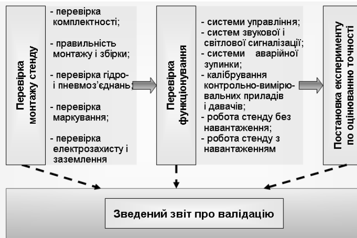
Рис. 3. Операційні процедури валідації стенду для випробувань фрикційних пар

Перелік операційних процедур валідації наведено на рисунку 3.