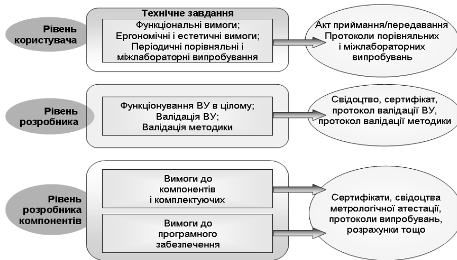
Рис. 2. Рівні верифікації ВУ і звітна документація

Верифікацію ВУ доцільно проводити на трьох рівнях: розробника компонентів і комплектуючих, розробника ВУ в цілому, користувача (рис. 2). На рисунку 2 наведено також примірний перелік документації за результатами верифікації.