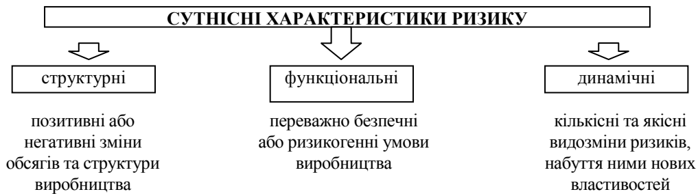
Рис. 1. Сутнісні характеристики ризику за І.Є. Калмиковою [1, С. 7]

недоотримання очікуваних фінансових результатів в умовах невизначеності умов функціонування підприємства. Проте І.Є. Калмикова вважає, що «наявність різноманітності визначень ризику в економічній літературі вказує на те, що дана економічна категорія не набула загальноприйнятих, стійких, логічних ознак» [1, С. 13] та запропонувала сутнісні характеристики ризику (рис. 1).