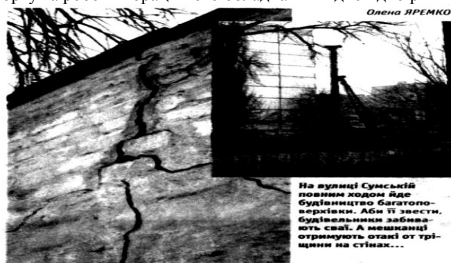
Рис. 2. Наслідки проявів екологічної небезпеки під впливом техногенних землетрусів (забиття паль при будівництві будинку)