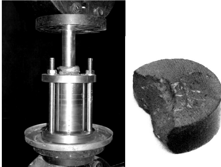
Рис. 3. Зневоднення ГВОМВ способом пресування

Зацікавленість також викликає мінімальна вологість ГВОМВ, що досягається при механічному способі зневоднення (як найменш енергоємному). Для встановлення цієї величини авторами були проведені досліді з видавлювання порової води з ГВОМВ способом пресування.