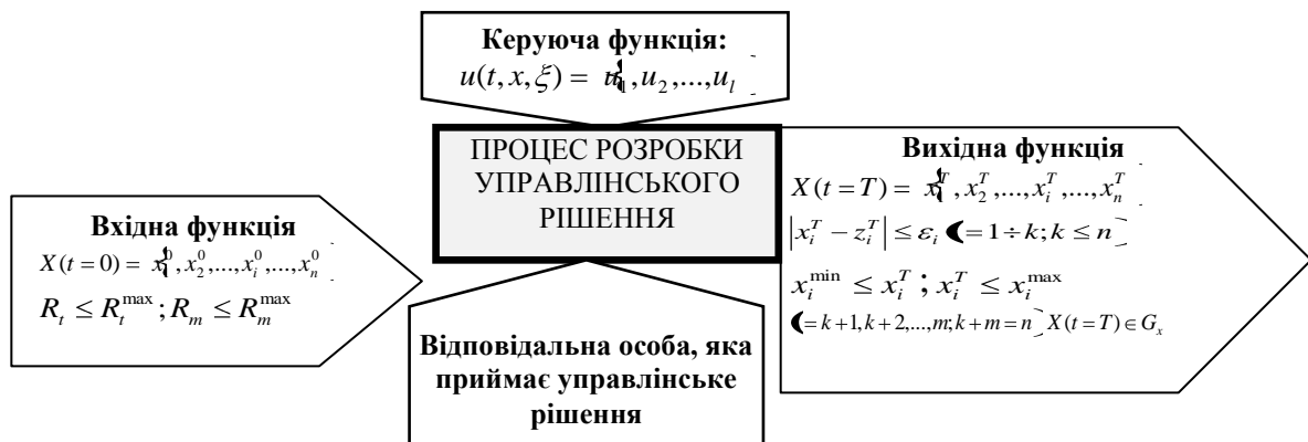
Рис. 1. Формалізована модель процесу розробки управлінських рішень в системі управління розвитком підприємства

Таким чином, запропонована формалізована модель процесу розробки управлінських рішень в системі управління розвитком підприємства (рис.1) має «вхід», «вихід», «механізми» та певну керуючу функцію. Так, на «вході» підприємство здійснює оцінку кількісних та якісних параметрів, які є визначальними під час прийняття управлінського рішення щодо розвитку підприємства, ідентифікує наявні у своєму розпорядженні ключові ресурси, оцінює фактори взаємодії. На «виході» формується цільова вихідна функція, на основі якої можливо врахування цільових параметрів із зазначенням можливих допустимих відхилень від запланованих значень у допустимих межах. При цьому, слід зазначити, що реалізація процесу прийняття ефективного управлінського рішення ускладнюється можливою альтернативністю визначених параметрів, які є параметрами керуючої функції та компетентністю відповідальної особи, яка розробляє та, з безлічі можливих альтернатив, обирає те рішення, яке є найбільш доречним в певній ситуації. Саме необхідність оцінки альтернатив u_1, u_2, \dots, u_l , їхня оцінка на відповідність критеріям переваг і співставлення з можливостями для досягнення цілей, актуалізує вирішення питання визначення детермінант технології прийняття управлінського рішення.