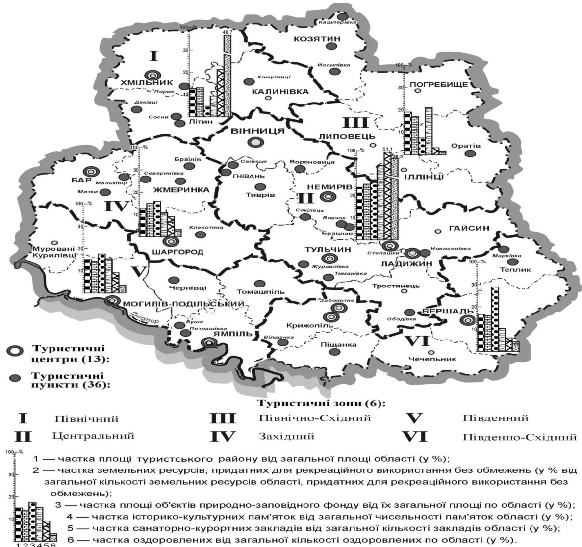
Рис. 1. Функціонально-територіальна структура ТРК і її елементи

Розподіл туристично-рекреаційного потенціалу області за виділеними вище туристськими зонами наведено в таблиці 1.