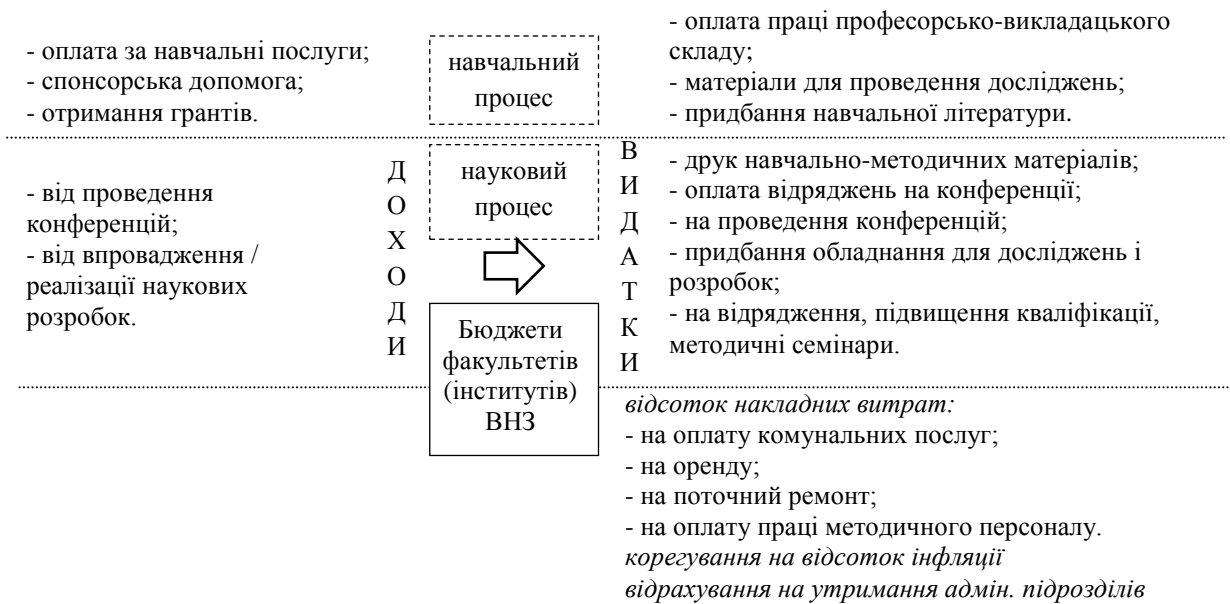
Рис. 2. Можлива структура бюджету підрозділів, які надають ліцензовані освітні послуги

доходів та видатків буде напряму прив'язаний до контингенту студентів (рис. 2).