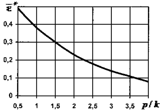
Рис. 2. Умови відколу кам'яного блоку при статичних навантаженнях

На рисунку 2 наведений графік залежності \bar{\varepsilon}^* від відношення p/k , який побудовано згідно з першою формулою (8).