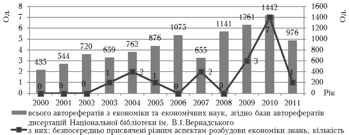
Рис. 1. Аналіз авторефератів дисертацій економічного спрямування, пов'язаних з дослідженням проблем розбудови економіки знань в Україні (складено автором)

авторефератів дисертаційних робіт за період з 2000 по 2011 рр. (табл. 1) вказують, що дана проблематика не є достатньо опрацьованою. На сьогодні визначено 17 дисертаційних робіт (з них лише 4 докторські роботи), а розкриті в них питання стосуються окремих аспектів розвитку економіки знань в нашій країні, дослідження мають несистематичний характер та фрагментарні результати (рис. 1).