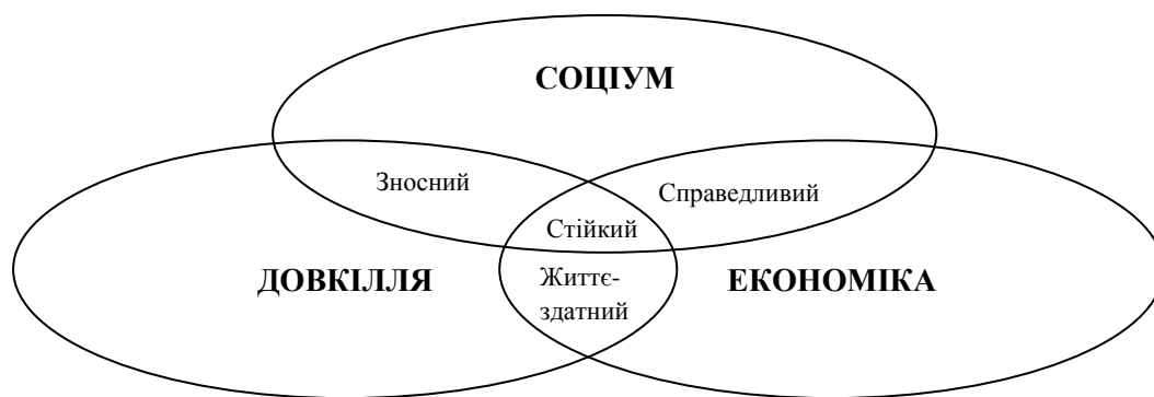
Рис. 1. Триєдина концепція стійкого розвитку [4]

Результатом впровадження концепції СВБ є ведення соціально відповідальної діяльності, спрямованої як на ефективне стратегічне управління підприємством, так і на попередження ускладнень, які виникають в умовах економічної, соціальної та екологічної кризи.