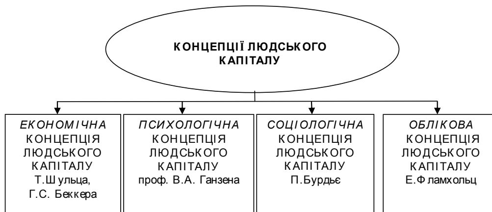
Рис. 3. Сучасні концепції людського капіталу*

*Примітка: узагальнено і систематизовано на підставі досліджених автором наукових джерел