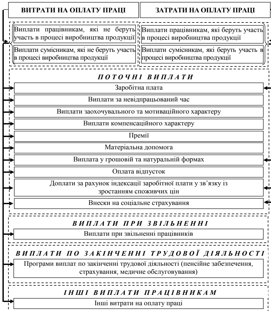
Рис. 4. Структура витрат та затрат на оплату праці з урахуванням видів виплат працівникам

Відповідно до складу витрат на оплату праці включаються поточні виплати, виплати при звільненні, виплати по закінченні трудової діяльності та інші виплати працівникам у повному їх складі. У свою чергу, до поточних витрат на оплату праці враховуються такі складові елементи: заробітна плата, виплати за невідпрацьований час, виплати заохочувального, мотиваційного та компенсаційного характеру, премії, матеріальна допомога, виплати у грошовій та натуральній формах, оплата відпусток та доплати за рахунок індексації заробітної плати у зв'язку із зростанням споживчих цін, внески на соціальне страхування.