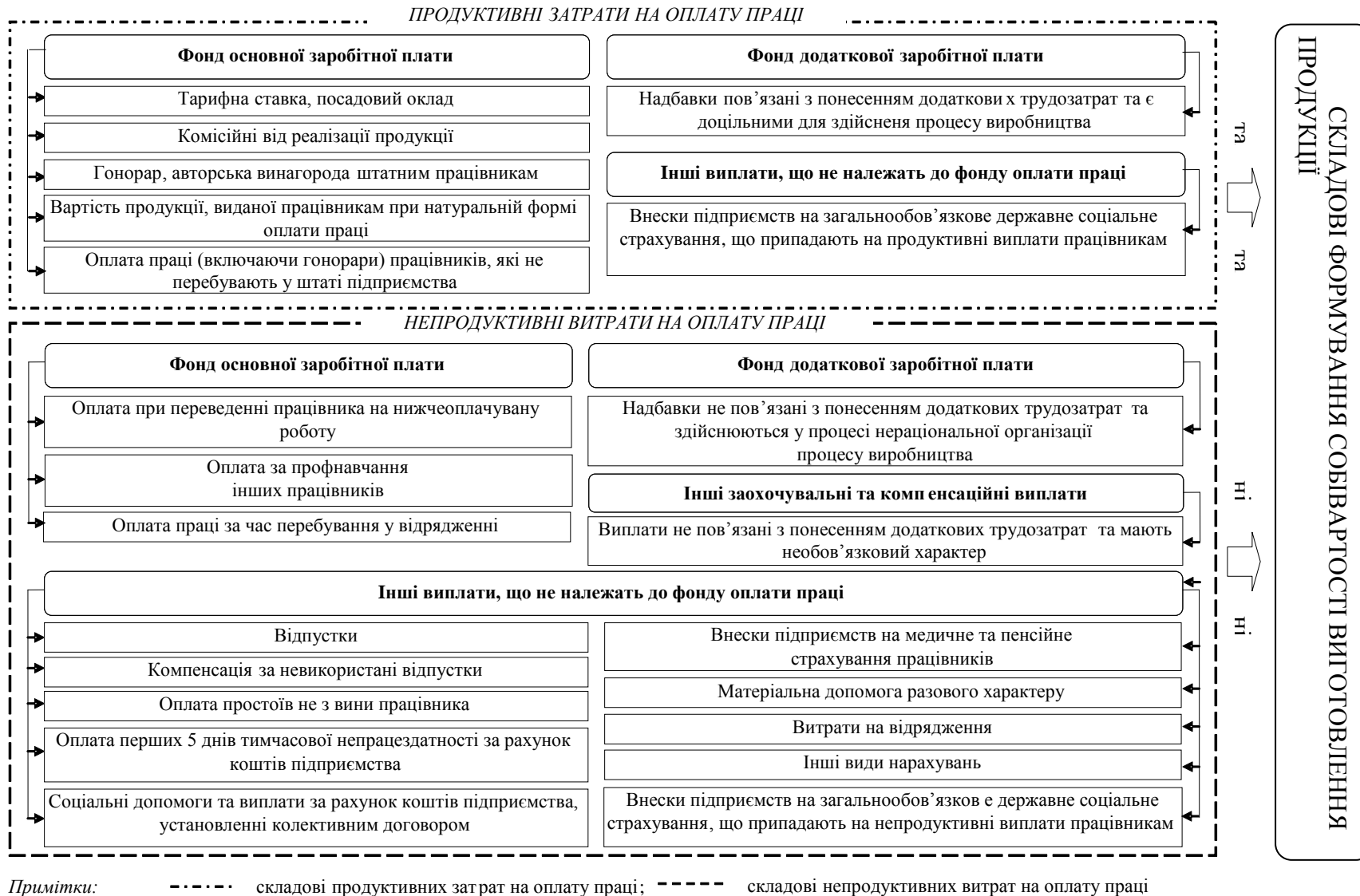
Рис. 5. Розмежування витрат на оплату праці на продуктивні затрати та непродуктивні витрати