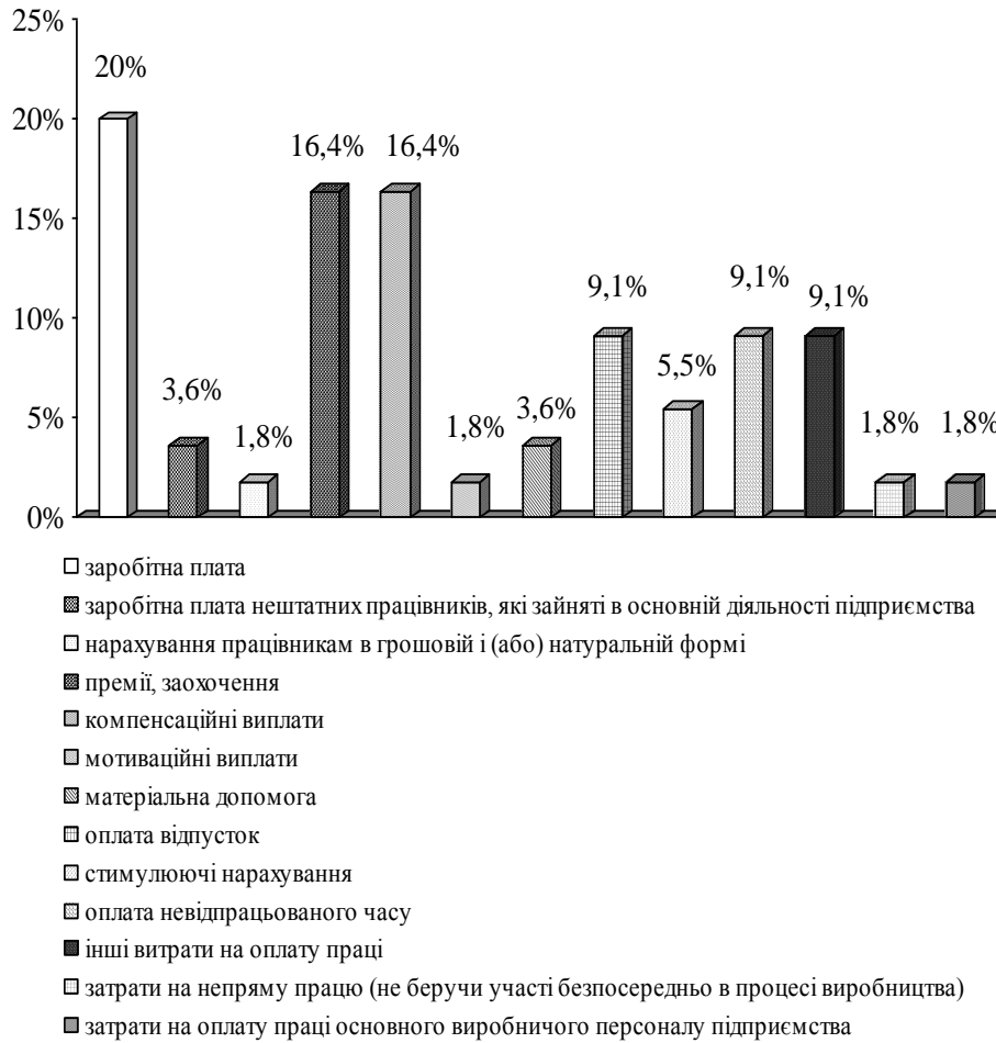
Рис. 1. Систематизація елементів витрат на оплату праці

Викладення основного матеріалу. При формуванні собівартості продукції управлінському персоналу слід особливу увагу приділяти формуванню продуктивних витрат, що передбачені раціональною організацією та технологією виробництва. Саме понесення продуктивних витрат окрім досягнення виробничих цілей передбачає здобуття певних економічних результатів (зокрема, виробництво додаткової продукції, підвищення рівня її якості – що дає можливість отримання додаткового прибутку).