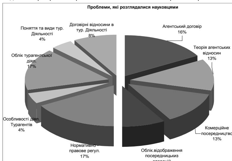
Рис. 3. Огляд проблем, які стосуються питання агентських відносин

Проблеми, які стосуються питання агентських відносин і які дослідженні в працях різних науковців можемо спостерігати на рис. 3