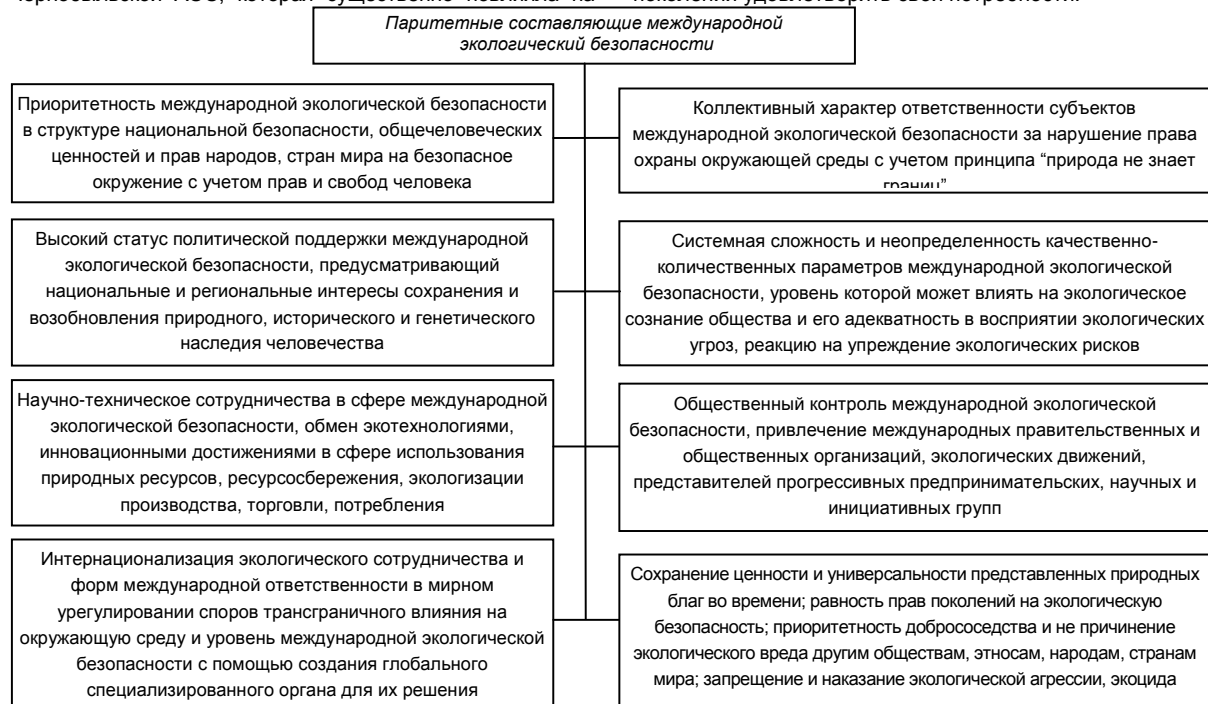
Рис. 1. Основные паритетные составляющие международной экологической безопасности

На данном этапе развития происходит становление новой парадигмы будущего человеческой цивилизации, которое определено международным сообществом как фундаментальное направление формирования международной экологической безопасности на основе Концепции устойчивого развития мира. Она определяет стратегическую необходимость удовлетворения потребностей современного поколения с учетом безопасности формирования потенциала следующих поколений удовлетворять свои потребности.