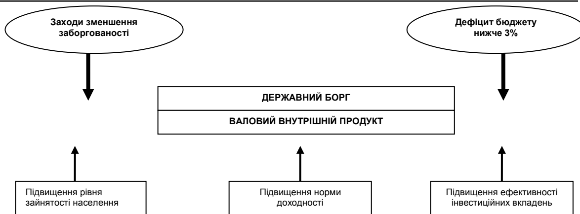
Рис 2. Загальна схема заходів впливу на зменшення державного боргу в Угорщині