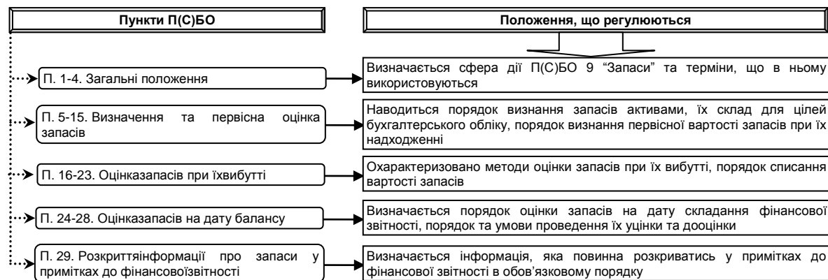
Рис. 2. Структура П(С)БО 9 "Запаси"

Вимоги П(С)БО 9 "Запаси" регулюють питання методологічного наповнення бухгалтерського обліку виробничих запасів. Проте, залишаються невирішеними ряд питань, що створюють методичну неузгодженість на практиці. Зокрема відсутній порядок бухгалтерського обліку виробничих запасів, що не використовуються у господарській діяльності підприємства більше одного року та не можуть бути реалізовані, у зв'язку з відсутністю попиту на них; не врегульовано бухгалтерський облік виробничих запасів, які надійшли безоплатно та не використовуються в господарській діяльності, а, отже, не підпадають під критерій тих, що приносять економічну вигоду; не уточнено, яким чином обліковувати такий об'єкт виробничих запасів як тара: зворотна тара та тара-обладнання; у складі яких складових виробничих запасів відображати зворотні відходи; вибір оптимального методу оцінки виробничих запасів при надходженні і вибутті; порядок визнання витрат щодо зберігання запасів та витрат на підвищення якості виробничих запасів тощо. Ці моменти не обумовлені в методичних рекомендаціях з бухгалтерського обліку запасів.