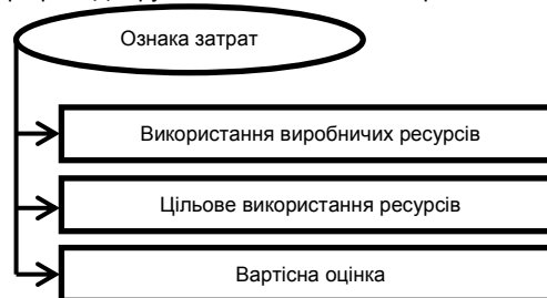
Рис. 3. Ознаки затрат

Умовно ресурси можна поділити на фінансові і виробничі. У відповідності з відношенням ресурсів до процесу виробництва, затратами можна вважати вартісну оцінку виробничих ресурсів організації, що використовуються. Так, згідно з цим визначенням можна виділити три ознаки затрат (рис. 3).