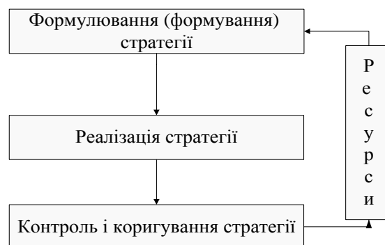
Рис. 1. Стадії життєвого циклу стратегії розвитку виробничих систем

Стратегія в своєму розвитку проходить такі стадії: формулювання, реалізація і контроль (рис. 1).