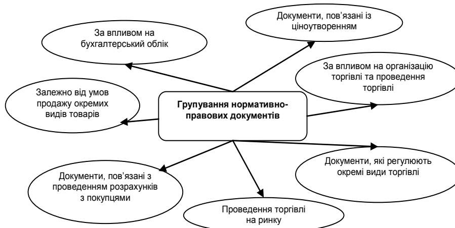
Рис. 1. Групування нормативно-правових документів, які стосуються торговельної діяльності

Вважаємо, що нормативно-правові документи за відношенням до торговельної діяльності можна групувати за наступними ознаками (рис. 1).