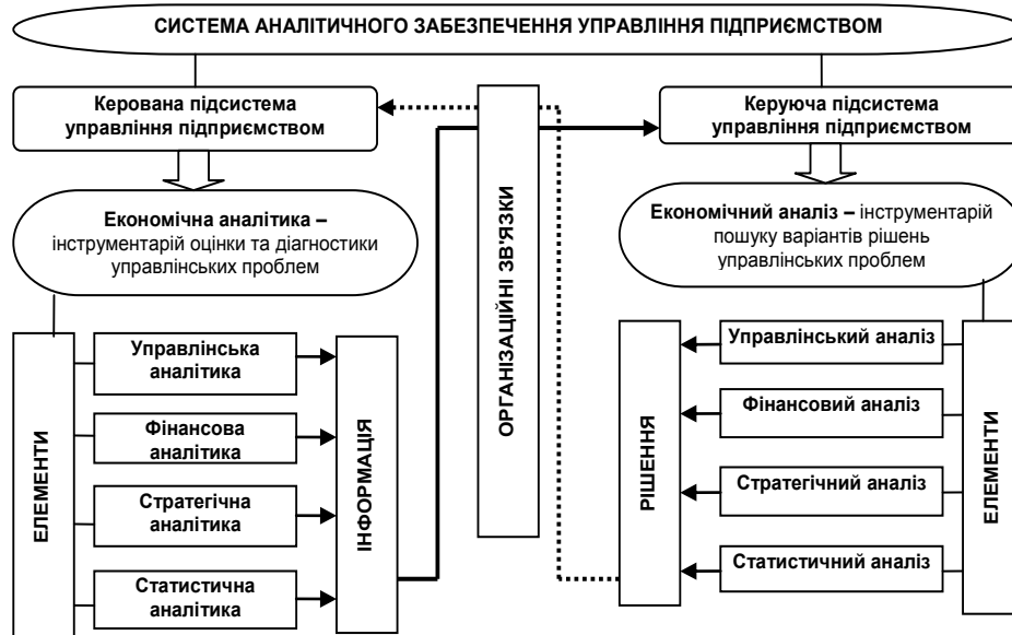
Рис. 2. Компоненти системи аналітичного забезпечення управління суб'єктами підприємницької діяльності

Для реінжинірингу системи аналітичного забезпечення управління підприємством весь процес перепроєктування доцільно поділити на наступні етапи: