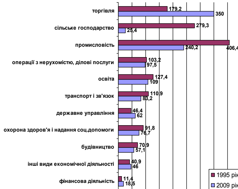
Рис. 2. Кількість зайнятого населення за видами економічної діяльності у 1995 та 2009 рр. в Харківській області, у тис. осіб.