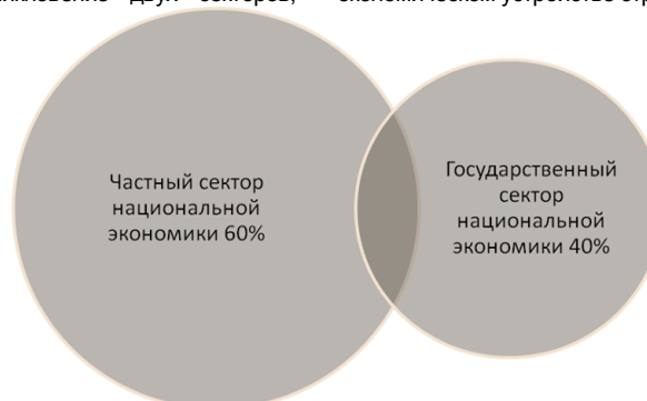
Рис. 3. Двухсекторная модель национальной экономики Украины в 2010 г.

связанное с существованием совместных хозяйствующих объектов в экономике страны, характерно не только для экономики нашей страны, а является распространенным явлением для всех смешанных экономик. Поэтому правильнее было бы показать существование области смешанного государственно-частного взаимодействия в системе национального хозяйства, который на рис. 3 изображен на пересечении этих двух секторов. Ее можно было бы назвать совместным межсекторным сегментом национальной экономики, отражающим не абсолютную, а относительную обособленность частного и государственного подразделений в экономическом устройстве страны.