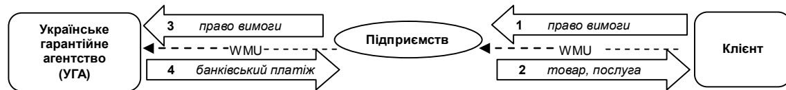
Рис. 1. Схема процесу реалізації товару з отриманням прав вимоги

Операція з продажу товару (надання послуги) в обмін на право вимоги між підприємством та клієнтом може бути оформлена договором, в тому числі і у вигляді оферти на сайті, і підтверджена відповідними первинними бухгалтерськими документами, які оформляються так само, як і при звичайній покупці товару, послуги за грошові кошти.