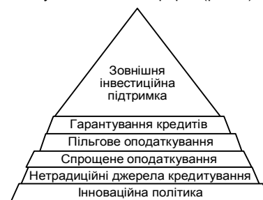
Рис. 1. Ієрархія методів, за допомогою яких здійснюється державна підтримка розвитку підприємництва (побудовано автором)

З метою більш ґрунтовного їх розуміння виникає потреба в побудові їх певної ієрархії (рис. 1).