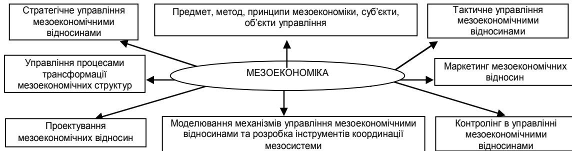
Рис. 2. Базова модель дослідження структури мезоекономіки

Запропоновано розглядати мезоекономічні відносини регіону як парні й групові, вертикальні й горизонтальні взаємодії. Причому групуватися можуть як суб'єкти управління, так і предмети взаємодії.