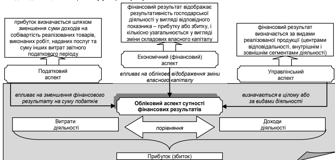
Рис. 3. Сутність фінансового результату: обліковий аспект

Вважаємо, з метою удосконалення нормативно-правового регулювання бухгалтерського обліку фінансових результатів в частині уточнення понятійного апарату та підвищення інформаційного забезпечення управління суб'єктами господарювання фінансових результатів через правильне та однозначне їх розуміння доцільно удосконалити трактування поняття “фінансові результати” (рис. 3).