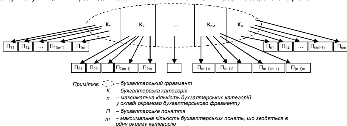
Рис. 3. Взаємозв'язок бухгалтерських категорій та бухгалтерських понять

В бухгалтерському обліку більш доцільно застосовувати другий підхід до розмежування категорій та понять, який графічно зображено на рис. 3.