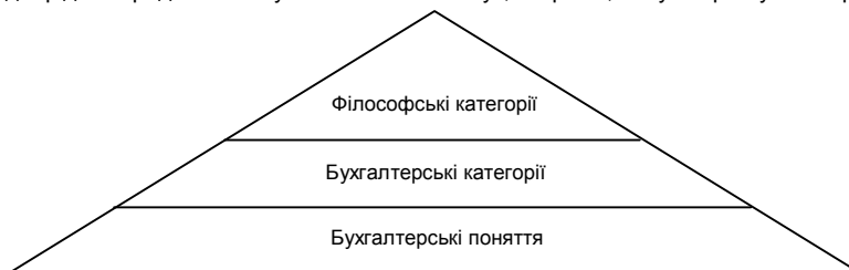
Рис. 2. Ієрархія між філософськими категоріями та бухгалтерськими категоріями і поняттями

Бухгалтерські категорії і поняття є субпідрядними по відношенню до філософських категорій, в яких виражаються загальні і часткові поняття функціональних наук, зокрема, і науки про бухгалтерський облік (рис. 2).