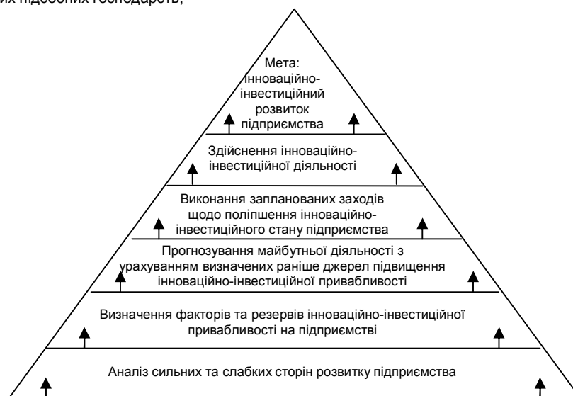
Рис. 2. Система інноваційно-інвестиційного розвитку на підприємстві

Підвищення інноваційно-інвестиційної привабливості як чітко спланований елемент стратегічного розвитку підприємства повинно відбуватися у рамках наступної системи (рис. 2).