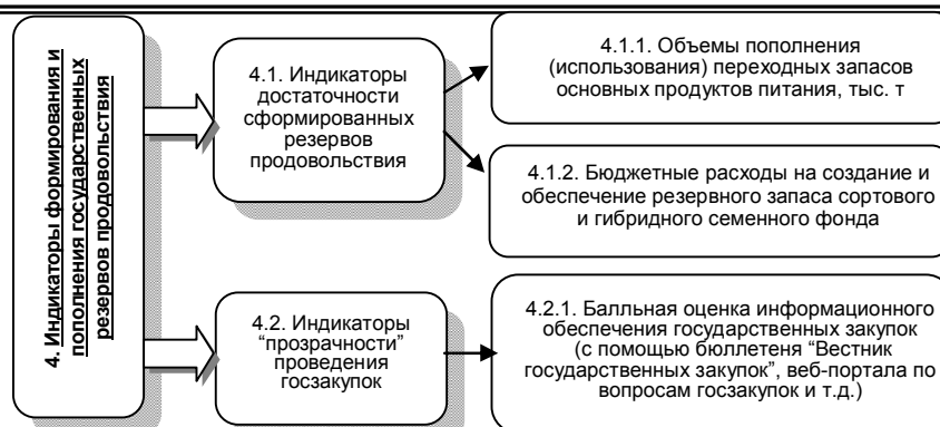
Рис. 4. Индикаторы формирования и пополнения государственных резервов продовольствия

Отдельно были выделены индикаторы финансового механизма (макроуровня), такие как уровень девальвации национальной валюты Украины.