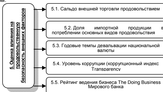
Рис. 5. Индикаторы воздействия внешних факторов на национальную продовольственную безопасность

Отдельно были выделены индикаторы финансового механизма (макроуровня), такие как уровень девальвации национальной валюты Украины.