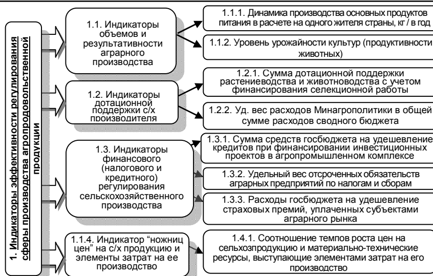
Рис. 1. Индикаторы эффективности регулирования сферы производства агропродовольственной продукции

Несбалансированность товарных рынков продовольствия, недостаточное обеспечение потребительского спроса на продовольствие негативно