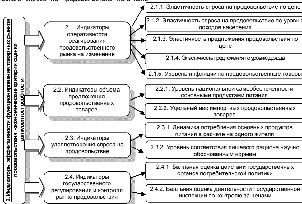
Рис. 2. Индикаторы эффективности функционирования товарных рынков продовольствия для обеспечения национальной продовольственной безопасности

Несбалансированность товарных рынков продовольствия, недостаточное обеспечение потребительского спроса на продовольствие негативно