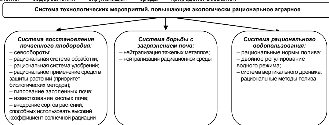
Рис. 2. Система мероприятий по оздоровлению окружающей среды в аграрном природопользовании

аграрное природопользование (рис. 2). Указанные позволяют понять задачи науки экономика аграрного направления оздоровления окружающей среды природопользования.