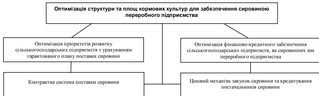
Рис. 2 Організаційно-економічний механізм формування товарно-кредитного кооперативу при створенні сировинної зони на основі контрактних відносин

З цієї метою на основі методів лінійного програмування нами розроблена економіко-математична модель оптимізації сировинної зони для переробного підприємства молочного напрямку та виробничої програми виробників сировини, зокрема молока.