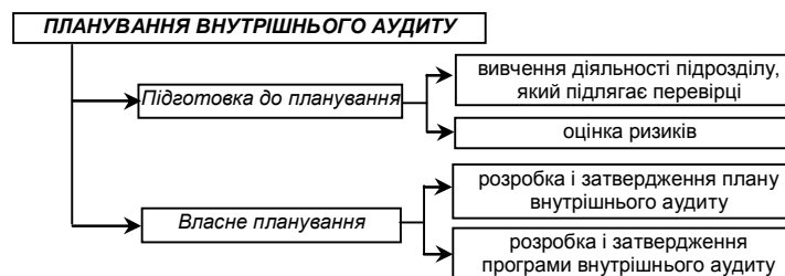
Рис. 2. Етапи планування внутрішнього аудиту

Вважаємо, що для забезпечення ефективності планування внутрішнього аудиту, весь процес планування необхідно розділити на два етапи (рис. 2).