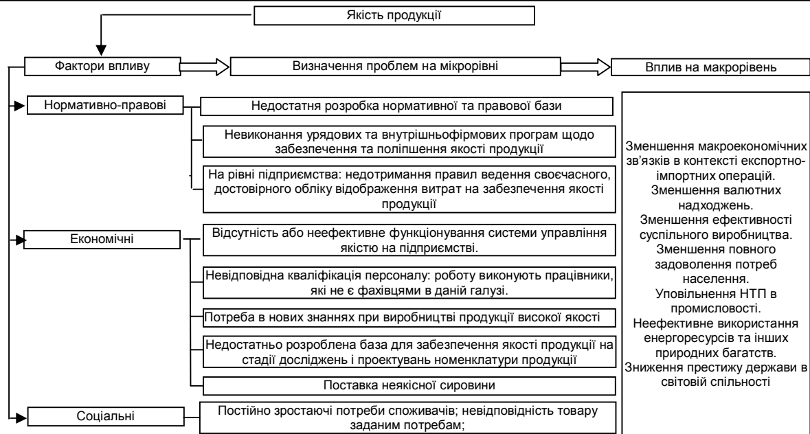
Рис. 3. Структурування проблем, що обумовлені забезпеченням якості продукції

Проблеми на мікрорівні визначаються внутрішньою специфікою виробництва суб'єкта господарювання (виробника продукції, товарів, робіт, послуг) та потребами домогосподарств, споживачів. Вплив на макрорівень визначається показниками, що характеризують країну на державному та світовому рівні. Тому важливим є розглянути вирішення даних проблем та їх вплив в цілому.