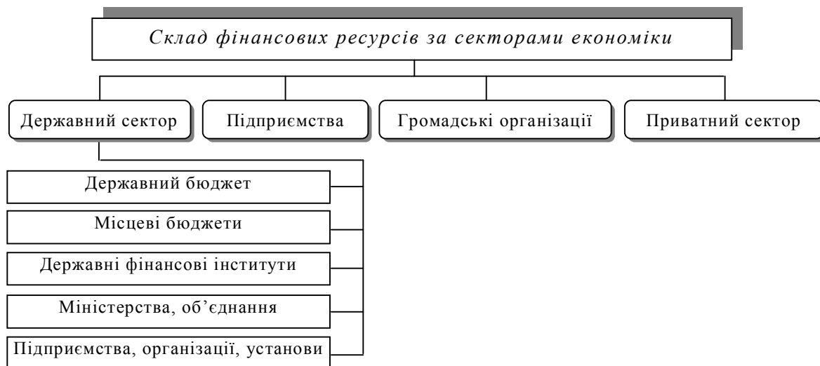
Рис.2. Склад фінансових ресурсів держави

В узагальнюючому вигляді склад фінансових ресурсів представлено на рис. 2.