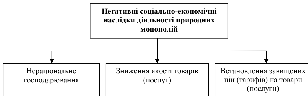
Рис. 2. Негативні соціально-економічні наслідки діяльності природних монополій в економічній системі суспільства

Захищаючи традиційну точку зору про необхідність державного регулювання природних монополій, вітчизняний науковець Г. Филук наголошує, що воно повинно обмежуватись певними рамками, які діють у двох площинах. З одного боку, регулювання має забезпечити надійний захист інтересів споживачів, недопущення зловживань