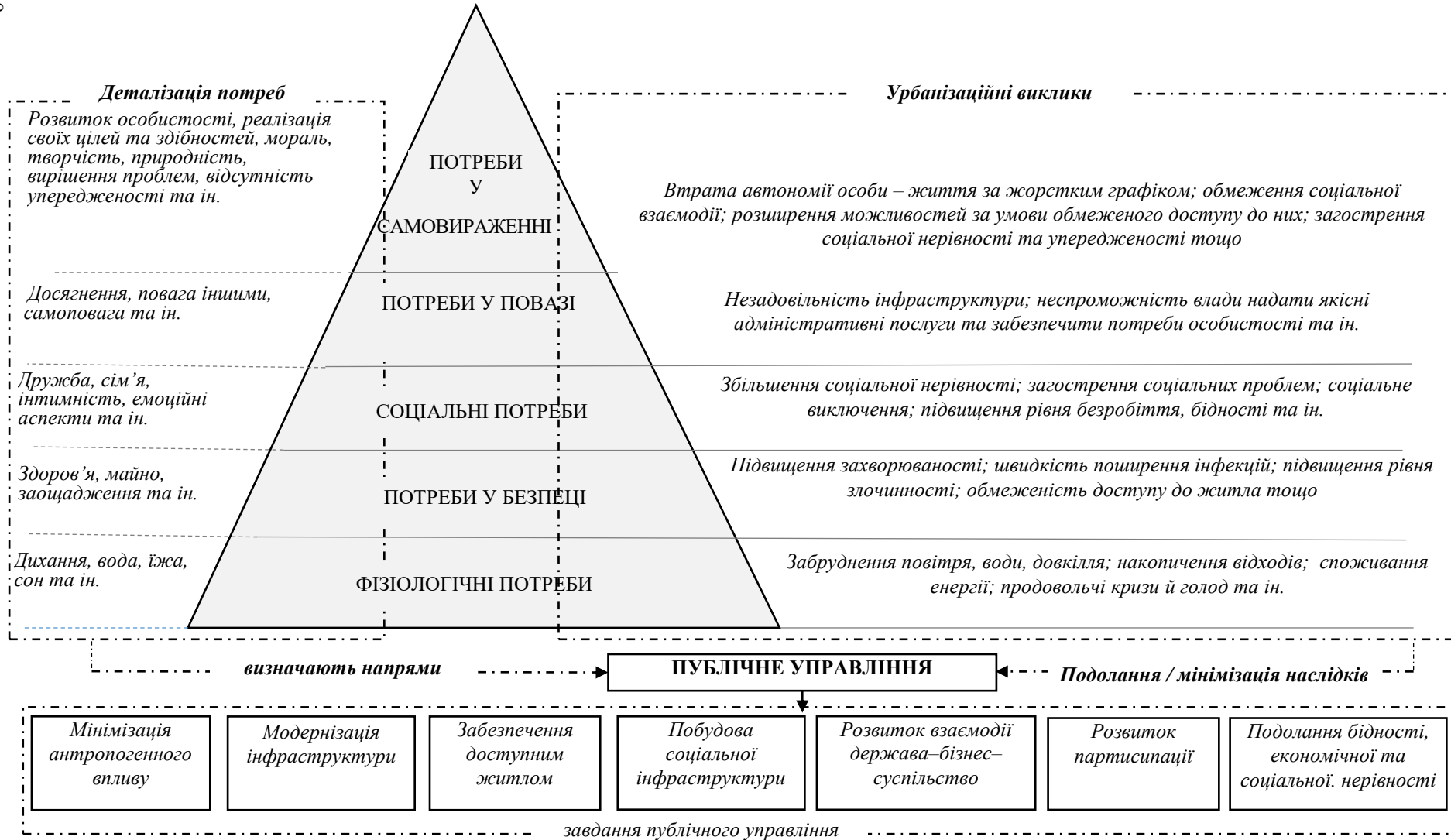
Рис. 2. Модель структуризації урбанізаційних викликів з позиції теорії ієрархічних потреб за А.Маслоу: ідентифікація завдань публічного управління