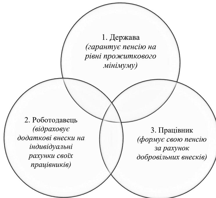
Рис. 1. Трирівнева модель пенсійної системи

Організація роботи пенсійної системи у більшості країн заснована на трирівневій моделі (рис. 1). Відповідно до такого підходу саме другий компонент становить значну частку в сукупній структурі пенсії громадянина.