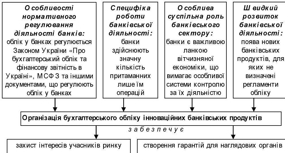
Рис. 1. Фактори впливу на організацію бухгалтерського обліку інноваційних банківських продуктів

Процес організації бухгалтерського обліку інноваційних банківських продуктів передбачає визначення та встановлення взаємозв'язку між певними етапами. В кількості та характеристиці визначених етапів погоджуємося з позицією значної кількості науковців [4; 3, с. 43–45; 10, с. 16–17] та вважаємо за необхідне розрізнити методичний (вибір способів та прийомів облікового відображення), технологічний (вибір способу обробки облікових даних, розробка складу і форм облікових реєстрів тощо) та організаційний (організація роботи облікового персоналу) етапи. Перші два пов'язані безпосередньо з організацією ведення облікових записів та визначаються, насамперед, під час формування облікової політики банку. Організаційний етап може бути також частково прописаний у Положенні (наказі) про облікову політику, проте він регламентується значно ширшим переліком документів.