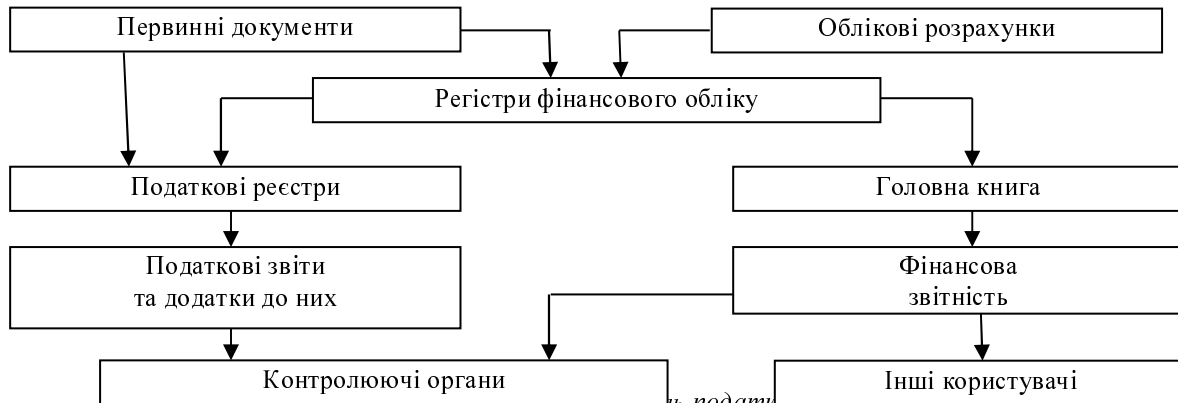
Рис. 1. Інформаційна модель податкового обліку

Самостійно розробити методику організації та ведення податкового обліку на підприємстві важко через відсутність методологічної підтримки з боку держави [5].